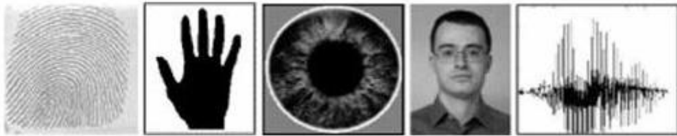
Hình 1.1. Các đặc trưng sinh trắc phổ biến

Đã có rất nhiều đặc trưng sinh học khác nhau đã và đang được sử dụng. Mỗi loại đặc trưng sinh trắc có điểm mạnh và điểm yếu riêng. Tuy nhiên không một đặc trưng nào thỏa mãn tốt và đầy đủ tất cả các yêu cầu tính chất của một đặc trưng sinh trắc học nêu trên, nghĩa là không có một đặc trưng sinh trắc học hoàn toàn tối ưu. Trong một công trình nghiên cứu, các chuyên gia đã đưa ra một bảng so sánh khái quát các tiêu chuẩn đánh giá các tính chất tương ứng các đặc trưng sinh trắc học sau đây: [1]